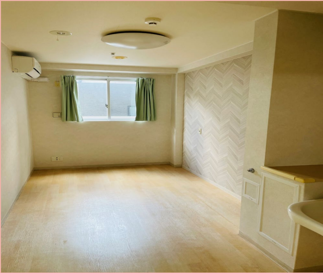
居 室 1