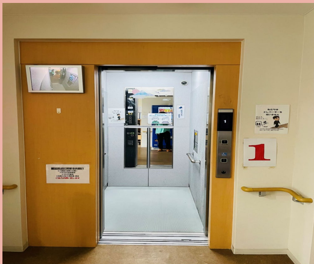
エ レ ベ ー タ ー