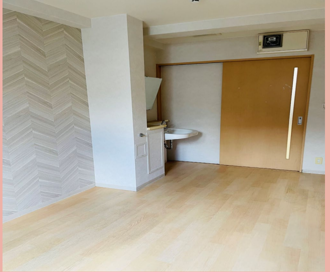
居 室 2