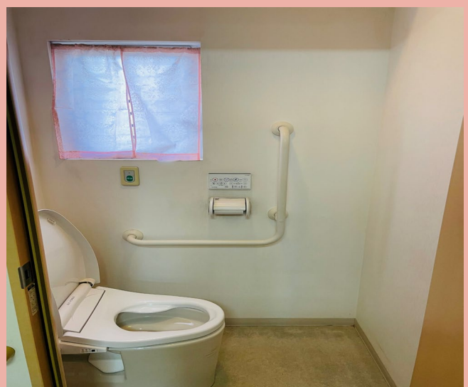
ト イ レ