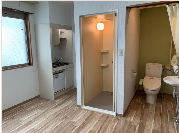
居 室 3