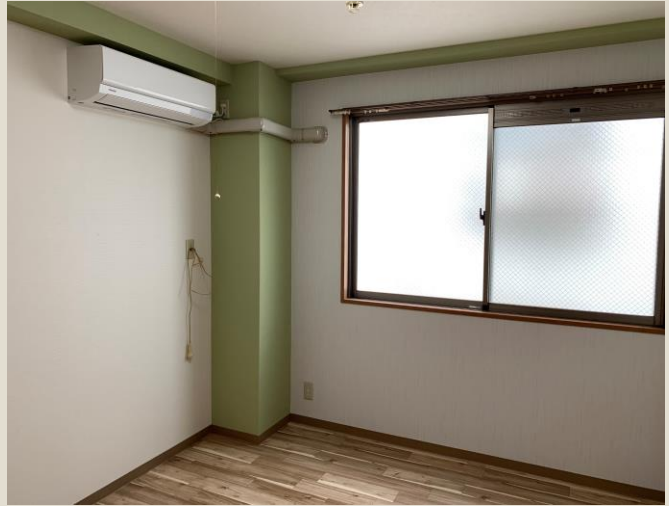
居 室 2