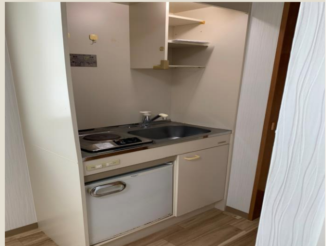
キ ャ ッ チ ン