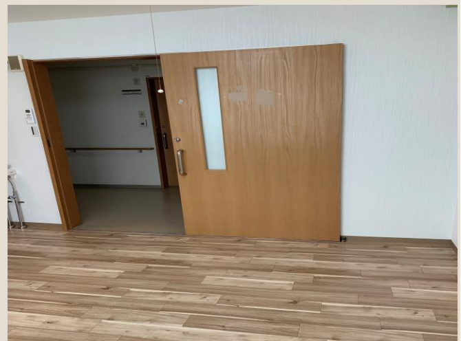
居 室 扉