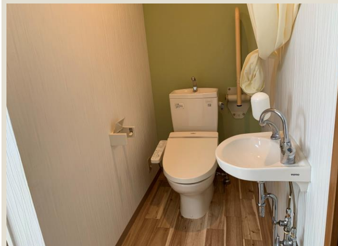
ト イ レ