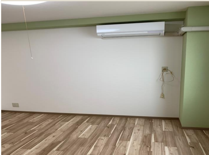
居 室 1