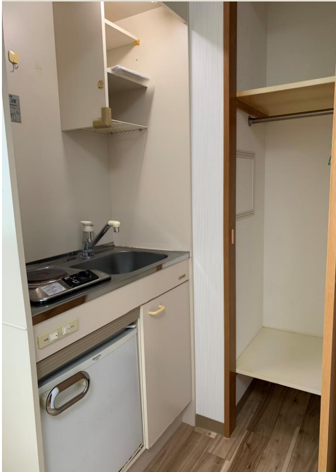
クローゼット・キッチン